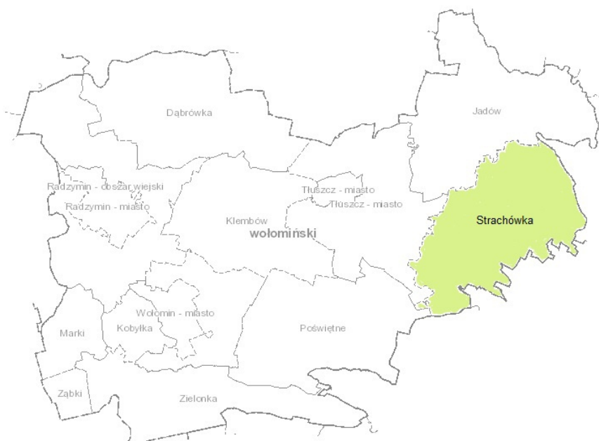
Położenie Gminy Strachówka w Powiecie Wołomińskim

Gmina jest położona w centrum województwa mazowieckiego w odległości ok. 60 km od Warszawy (przez Stanisławów), należy do powiatu wołomińskiego.